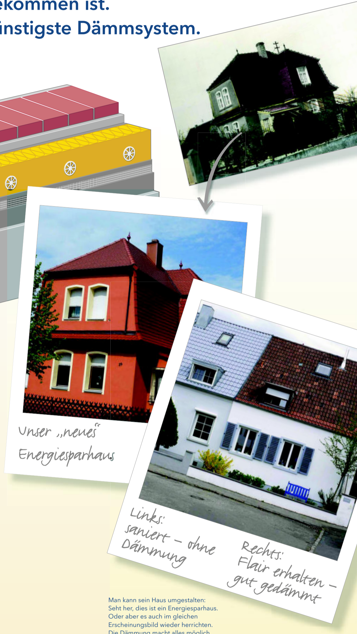
Man kann sein Haus umgestalten: Seht her, dies ist ein Energiesparhaus. Oder aber es auch im gleichen Erscheinungsbild wieder herrichten. Die Dämmung macht alles möglich.

Die Dämmstoffauswahl reicht von Kork über Polystyrol und Steinwolle bis zu Vakuumdämmplatten. Wer höheren Brandschutz will, wählt z.B. Steinwolleplatten. Wir empfehlen 12 cm Dämmdicke. Damit halten Sie auch die EnEV ein ( U = 0,24 \text{ W}/(\text{m}^2\text{K}) ).